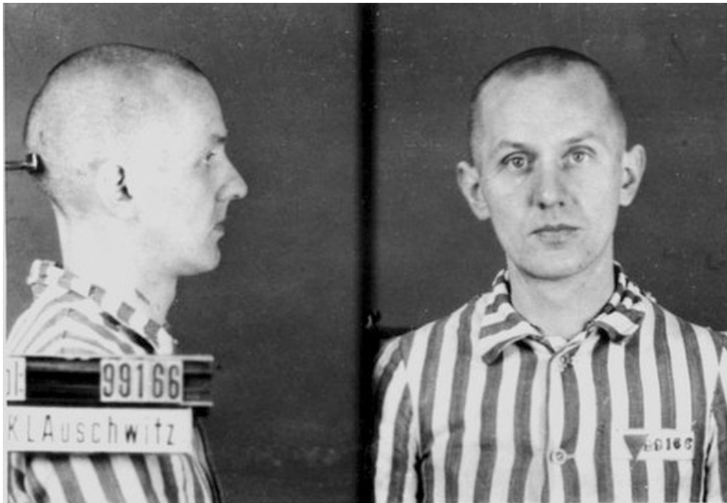
Вернер в Аушвіц-Біркенау