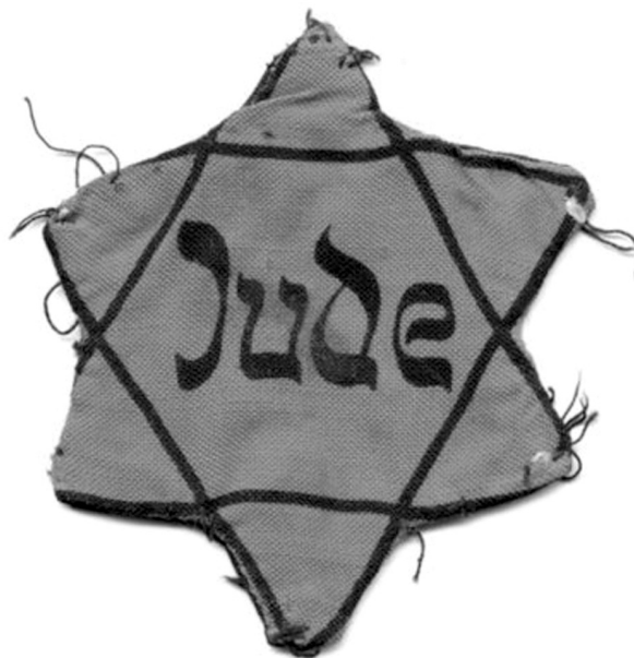
Gwiazda Dawida noszona przez Żydów podczas Holokaustu