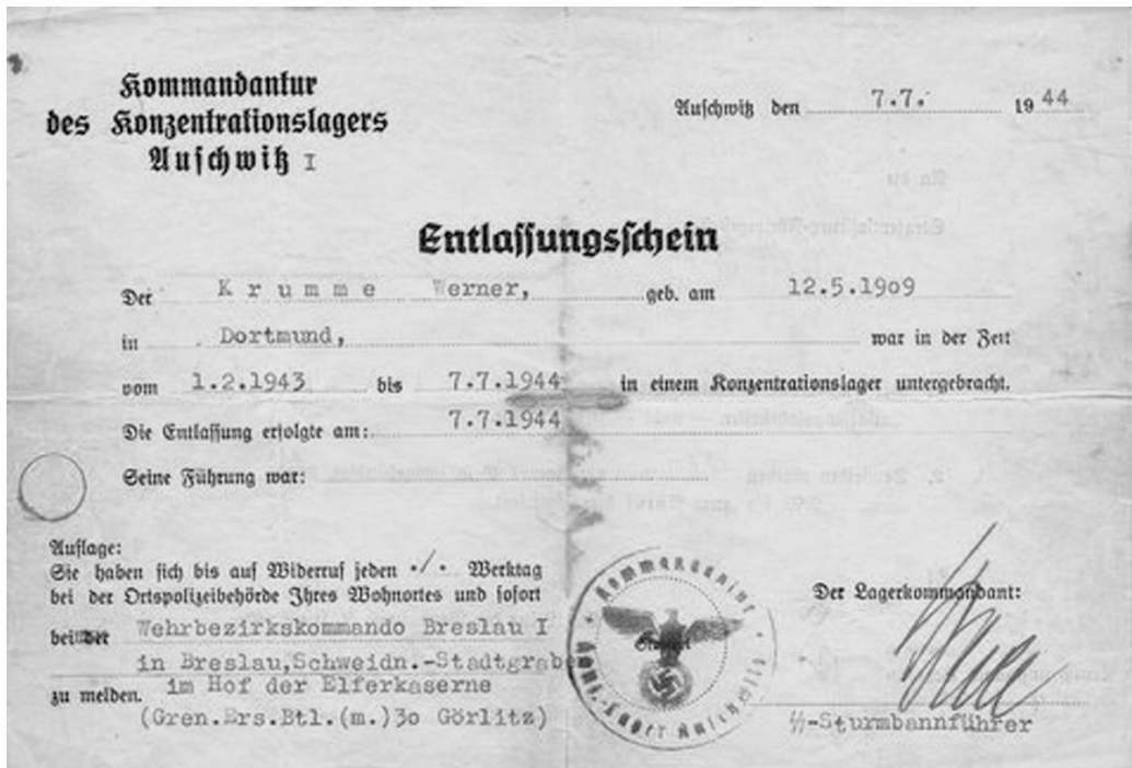
zwolnienie Wernera z Auschwitz-Birkenau